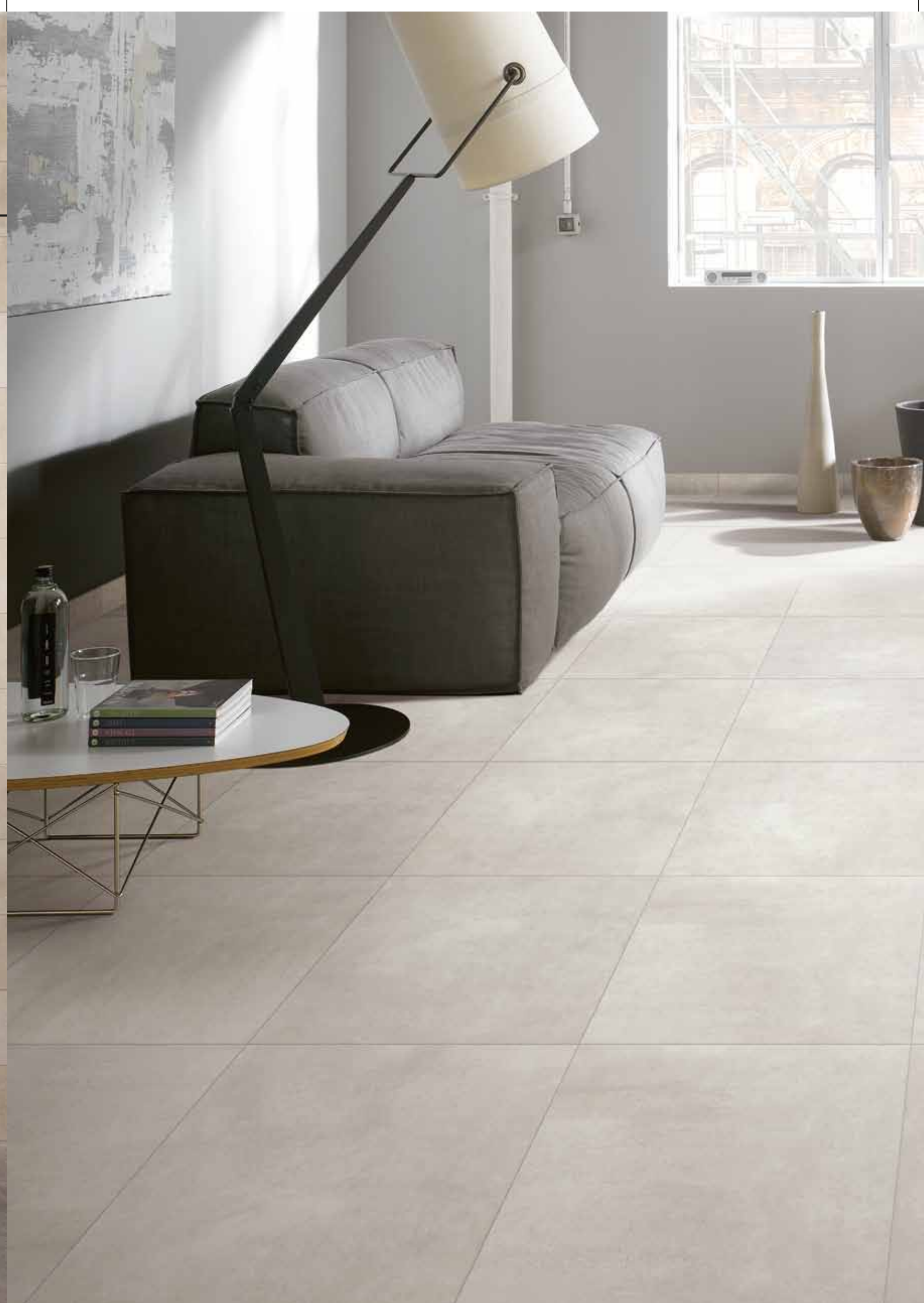
URBANITY GRIGIO 30x30cm/12x12" 20x60cm/8x24" 30x60cm/12x24" 60x60cm/24x24" 45x90cm/18x36"