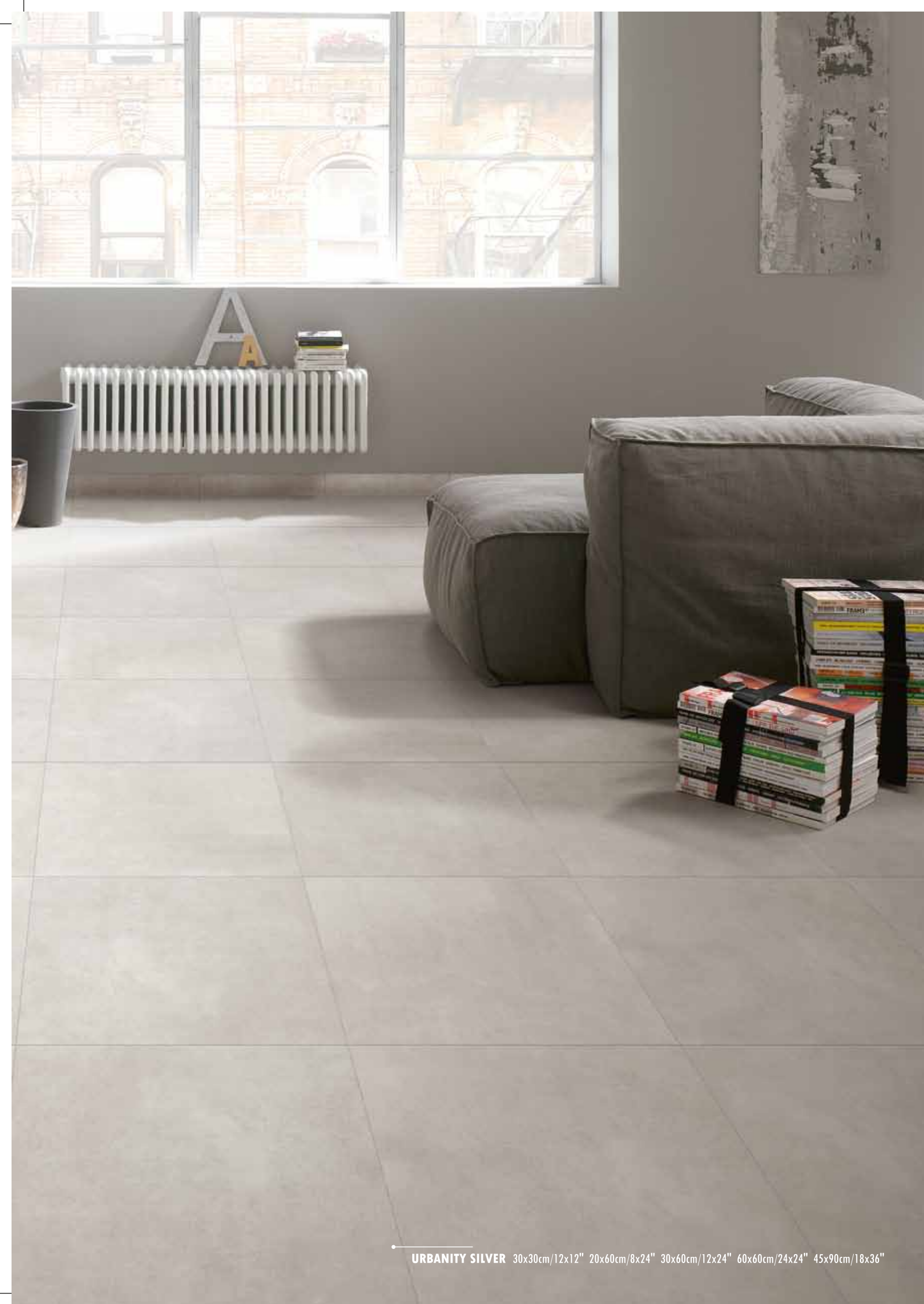
URBANITY SILVER 30x30cm/12x12" 20x60cm/8x24" 30x60cm/12x24" 60x60cm/24x24" 45x90cm/18x36"