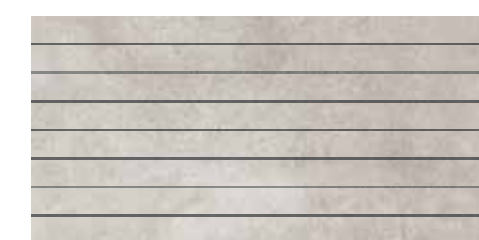
LINE 7 Size: 30x60cm