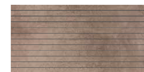
LINE 9 Size: 30x60cm